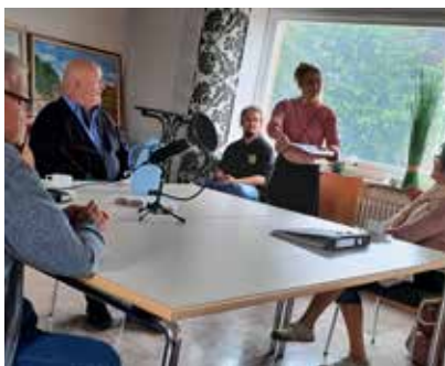
Am 20.09.2021 war das erste Erzählcafé „Die Kerwe in Waldmohr“, das Thema